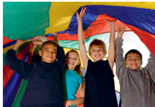
Hitzestau unter dem Fallschirm